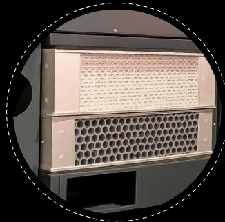
Con filtros de carbono