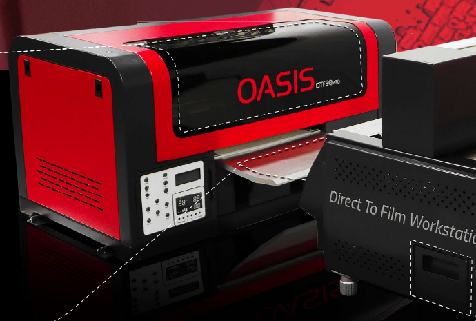
Ajuste del recolector de polvos para mayor autonomía