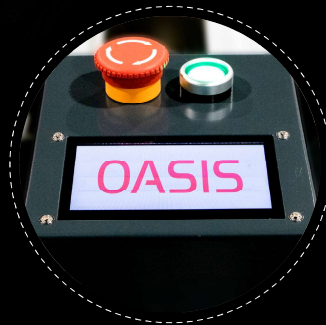
Ahora con pantalla táctil