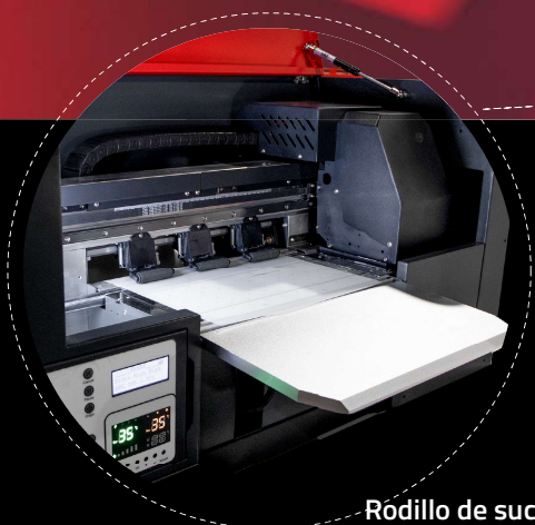
Rodillo de succión que mejora el avance del poliéster

¡¡Tenemos la convicción de que nuestras innovaciones nos colocan en la posición más adecuada para ofrecer una gran productividad e imágenes de una calidad excepcionalmente alta!!